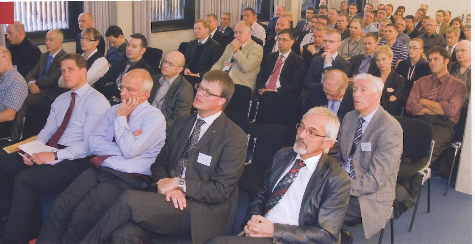
Aufmerksames Auditorium am 5. ZAGG-Symposium zum Thema «Nachhaltigkeit».